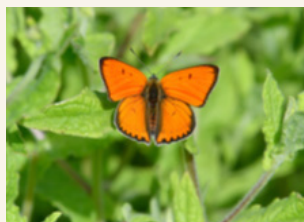
Cuivré des marais

Le reste du territoire sera prospecté en 2026 et donnera lieu par la suite à un atlas par commune et une cartographie des enjeux à l'échelle du territoire.