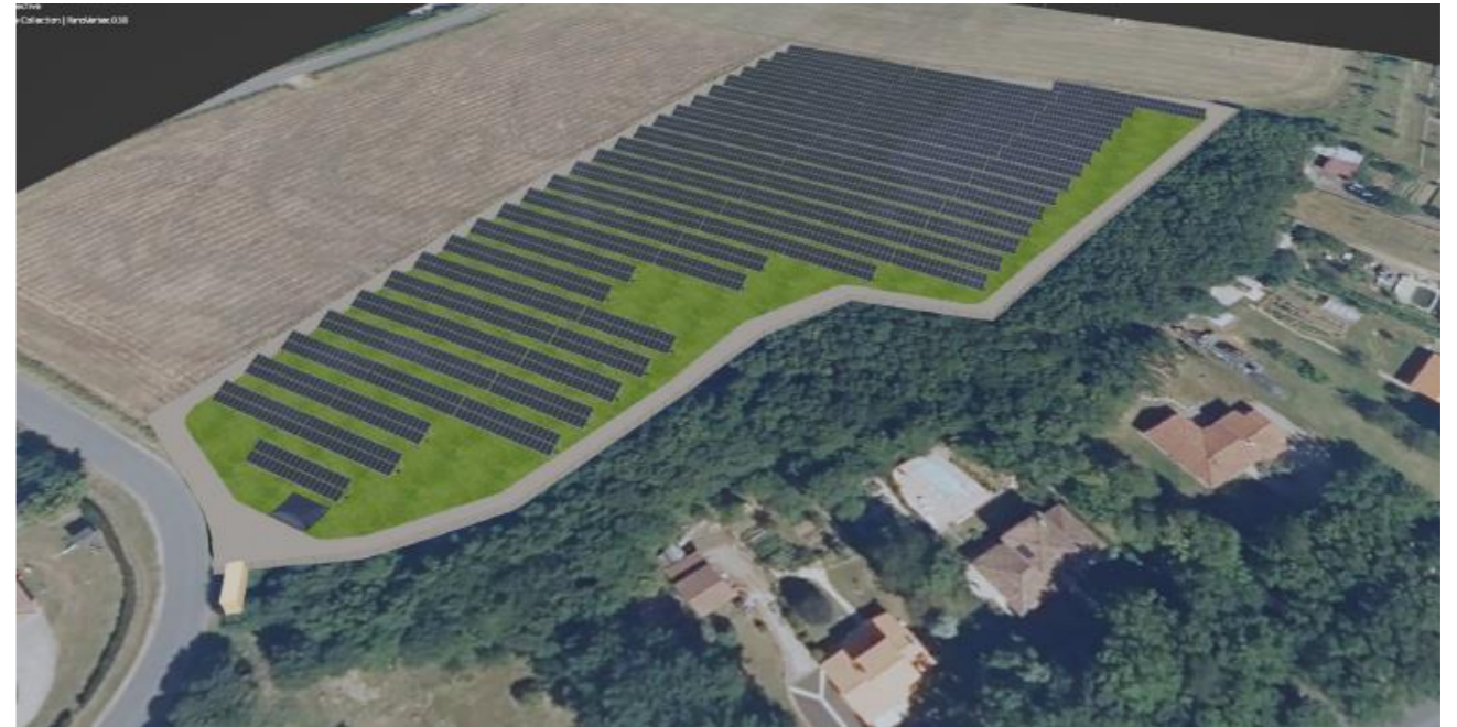
Visuel du projet, source : étude d'impact du projet

Les futurs panneaux couvriront une superficie d'environ 8 845 m 2