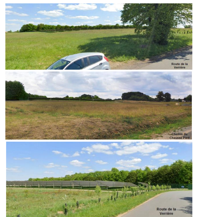
Photomontages de l'impact paysager du projet

L'impact paysager du projet entend demeurer très modéré , comme en témoignent les vues avec photomontage ci-dessous.